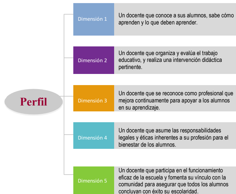
Esquema 2. Perfil del docente

La Evaluación del Desempeño tiene como referente el Perfil, parámetros e indicadores para docentes y técnicos docentes en Educación Básica del Ciclo escolar 2018-2019 aprobado por el INEE, dicho perfil está constituido por cinco dimensiones en las que se establece de manera genérica las características y los atributos que debe mostrar este personal en el ejercicio de su función.