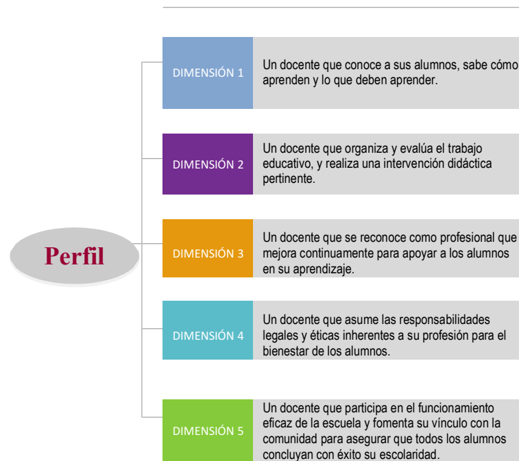
Esquema 2. Perfil del docente

La Evaluación del Desempeño tiene como referente el Perfil, parámetros e indicadores para docentes y técnicos docentes en Educación Básica del Ciclo escolar 2018-2019 aprobados por el INEE, dichos perfiles están constituidos por cinco dimensiones en las que se establece de manera genérica las características y los atributos que debe mostrar este personal en el ejercicio de su función.